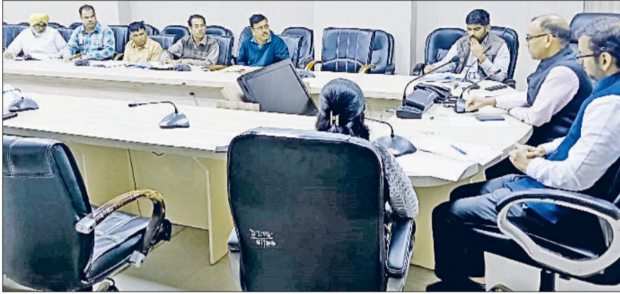
फतेहाबाद। जनगणना को लेकर अधिकारियों की बैठक को संबोधित करते उपयुक्त डॉ. विवेक भारती।

भारत सरकार द्वारा प्रस्तावित जनगणना 2027 देश के प्रशासनिक इतिहास में एक नया अध्याय जोड़ने जा रही है, क्योंकि यह भारत की पहली पूर्णतः डिजिटल जनगणना होगी। डीसी डॉ. विवेक भारती ने जनगणना की तैयारियों को लेकर आयोजित जिला स्तरीय बैठक में अधिकारियों को आवश्यक दिशा-निर्देश दिए। डीसी ने अधिकारियों को निर्देश देते हुए कहा कि जनगणना के लिए नियुक्त स्टाफ का उचित प्रशिक्षण कराया। प्रशिक्षण में सभी बिंदुओं को सही तरीके से कवर करें। बैठक में डिजिटल जनगणना प्रक्रिया की